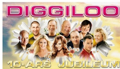
Musikevenemanget DIGGILOO firar 10-års jubileum och kommer till Trosa Hamn den 16 juni 2012.