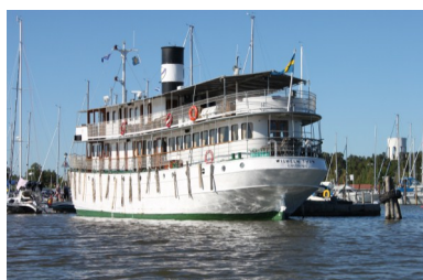
En av kanalbåtarna angör Trosa hamn sommaren 2011.